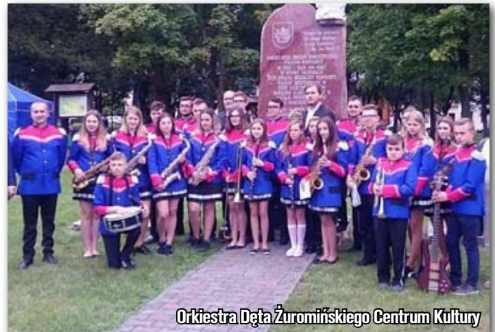
Orkiestra Dęta Żuromińskiego Centrum Kultury