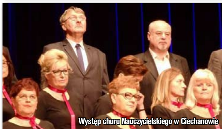
Występ choru Nauczycielskiego w Ciechanowie