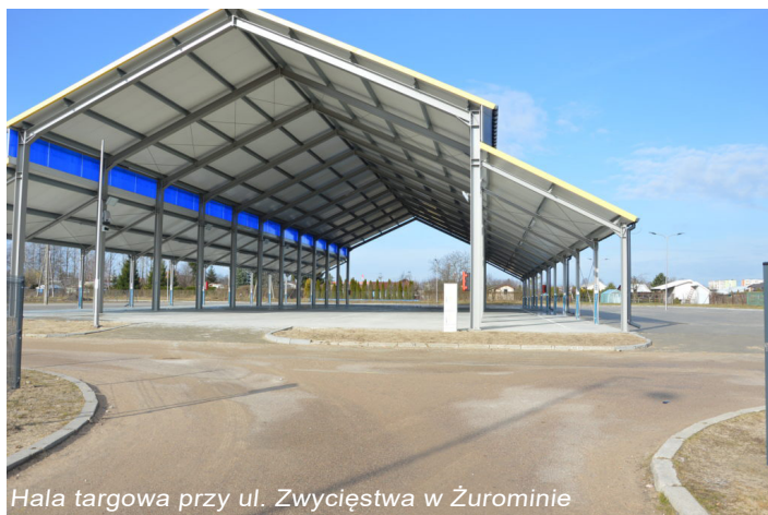
Hala targowa przy ul. Zwycięstwa w Żurominie

Zabytków – Polski Ład w kwocie 833 000 zł.