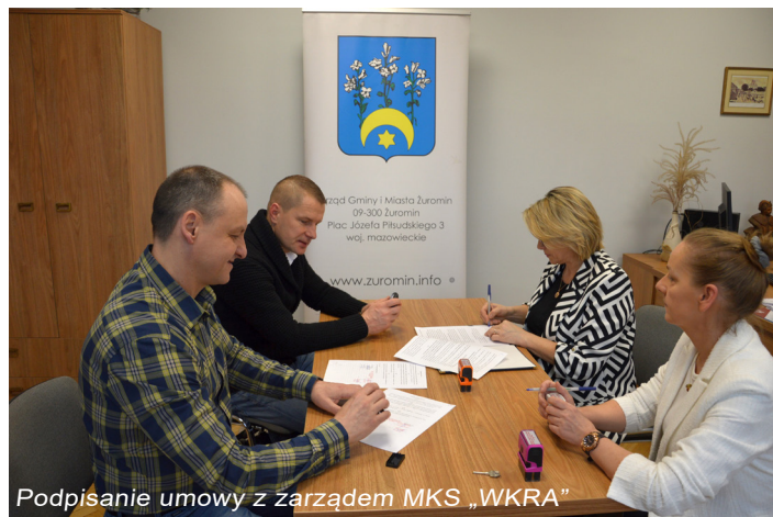
Podpisanie umowy z zarządem MKS „WKRA”