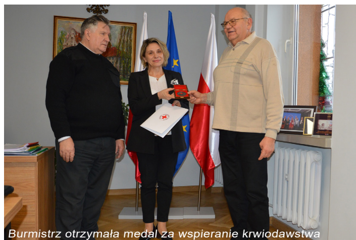
Burmistrz otrzymała medal za wspieranie krwiodawstwa

ku Rozmaitości w Warszawie. Mazowiecka Marka Ekonomii Społecznej to wyróżnienie przyznawane przez Samorząd Województwa Mazowieckiego podmiotom działającym na rzecz ekonomii społecznej na Mazowszu.