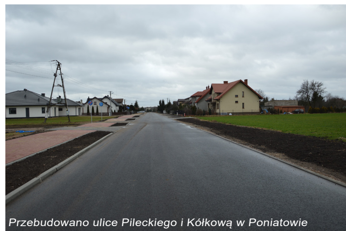
Przebudowano ulice Pileckiego i Kólkową w Poniatowie

- przebudowa ulicy Towarowej w Żurominie – koszt inwestycji to 3 290 777,42 zł. Inwestycja została dofinansowana z Rządowego