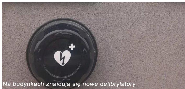
Na budynkach znajdują się nowe defibrylatory

Nr 1 w Żurominie, Szkole Podstawowej Nr 2 w Żurominie, w Szkole Podstawowej w Chamsku, w Szkole Podstawowej w Poniatowie, na Stadionie Miejskim i dworcu autobusowym. W ramach darowizny zostały również przeprowadzone szkolenia z obsługi defibrylatorów i pierwszej pomocy.