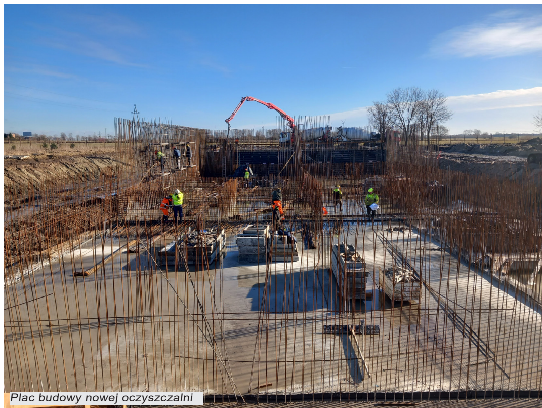
Plac budowy nowej oczyszczalni

Obecny obiekt oczyszczalni to konstrukcja z przełomu lat 70/80 ubiegłego wieku oparta o stare mechaniczne technologie oczyszczania ścieków, które nie pozwalają na jej modernizację i dostosowanie do wchodzących w życie wymogów prawnych związanych z jakością oczyszczonych ścieków. Po dokonaniu analiz rynku, przewidywanych kierunków procesów ochrony środowiska oraz możliwości pozyskania środków zewnętrznych, zdecydowaliśmy się na budowę nowej oczyszczalni z zastosowaniem technologii membranowej. MBR (z ang. Membrane Biological Reactor) to najnowocześniejsza technologia oczyszczania ścieków, gwarantująca najwyższą jakość ścieków oczyszczonych. Dzięki połączeniu elementów klasycznej technologii osadu czynnego oraz filtracji na membranach mikrofiltracyjnych, ścieki oczyszczone w reaktorach MBR spełniają najwyższe normy jakości, zarówno pod względem fizyko-chemicznym, jak i mikrobiologicznym. W myśl dyrektywy Unii Europejskiej filtracja membranowa jest w chwili obecnej rekomendowana jako najlepsza możliwa technologia oczyszczania ścieków.