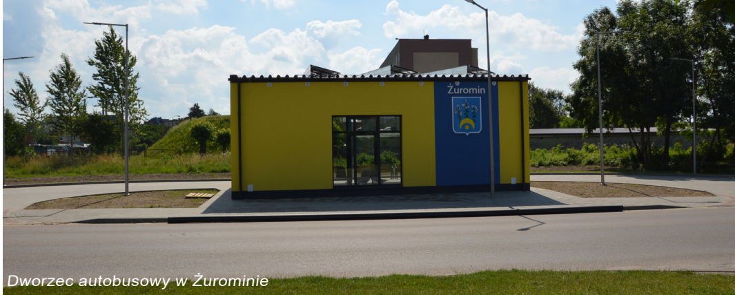
Dworzec autobusowy w Żurominie

Na przestrzeni ostatnich lat nasze miasto i gmina bardzo się zmieniła. Powstaje wiele nowych inwestycji, osiedli domów jednorodzinnych i wielorodzinnych. Remontowane są drogi, powstają place zabaw, miejsca do rekreacji i wypoczynku.