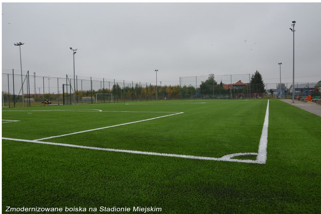
Zmodernizowane boiska na Stadionie Miejskim

- modernizacja oświetlenia ulicznego na terenie Gminy i Miasta Żuromin za kwotę 454 485,00 zł, kwota dofinansowania z Wojewódzkiego Funduszu Ochrony Środowiska i Gospodarki Wodnej w Warszawie to 300 000 zł,