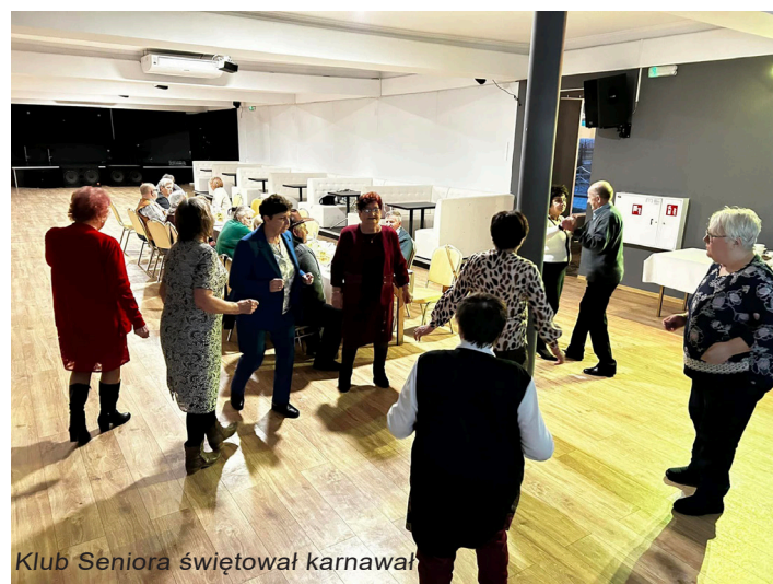
Klub Seniora świętował karnawał

Karnawał w Klubie Seniora Seniorzy nie zwalniają tempa. Aktywnie spędzają czas, nie tylko w Klubie. Karnawał postanowili również uczcić dobrą zabawą i dobrym jedzeniem.